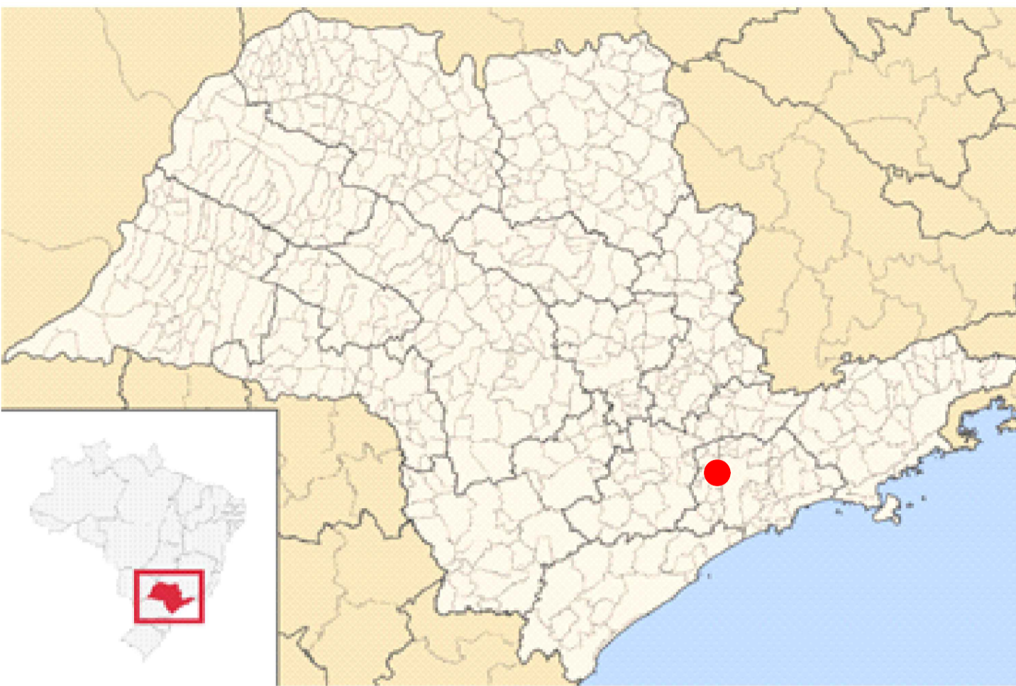
LOCALIZAÇÃO DE CARAPICUIBA EM SÃO PAULO S / ESCALA