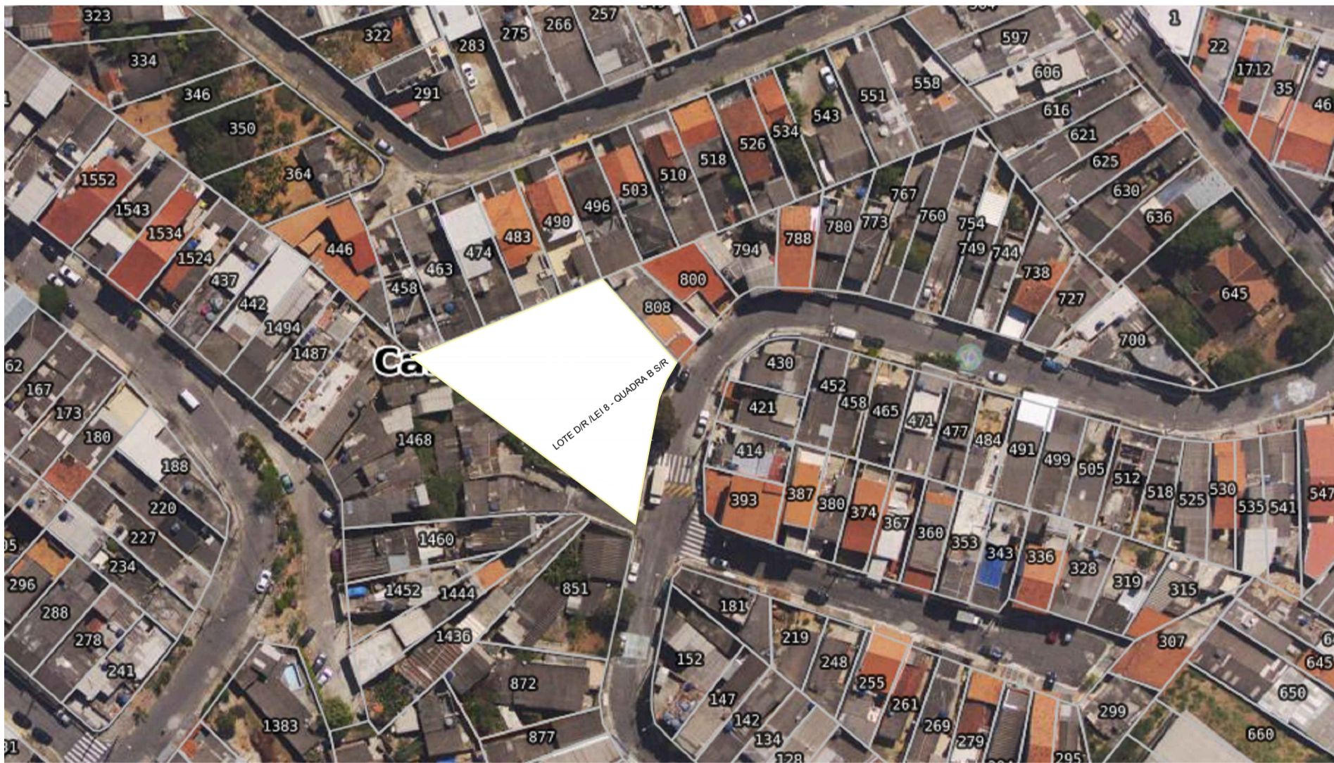
S / ESCALA