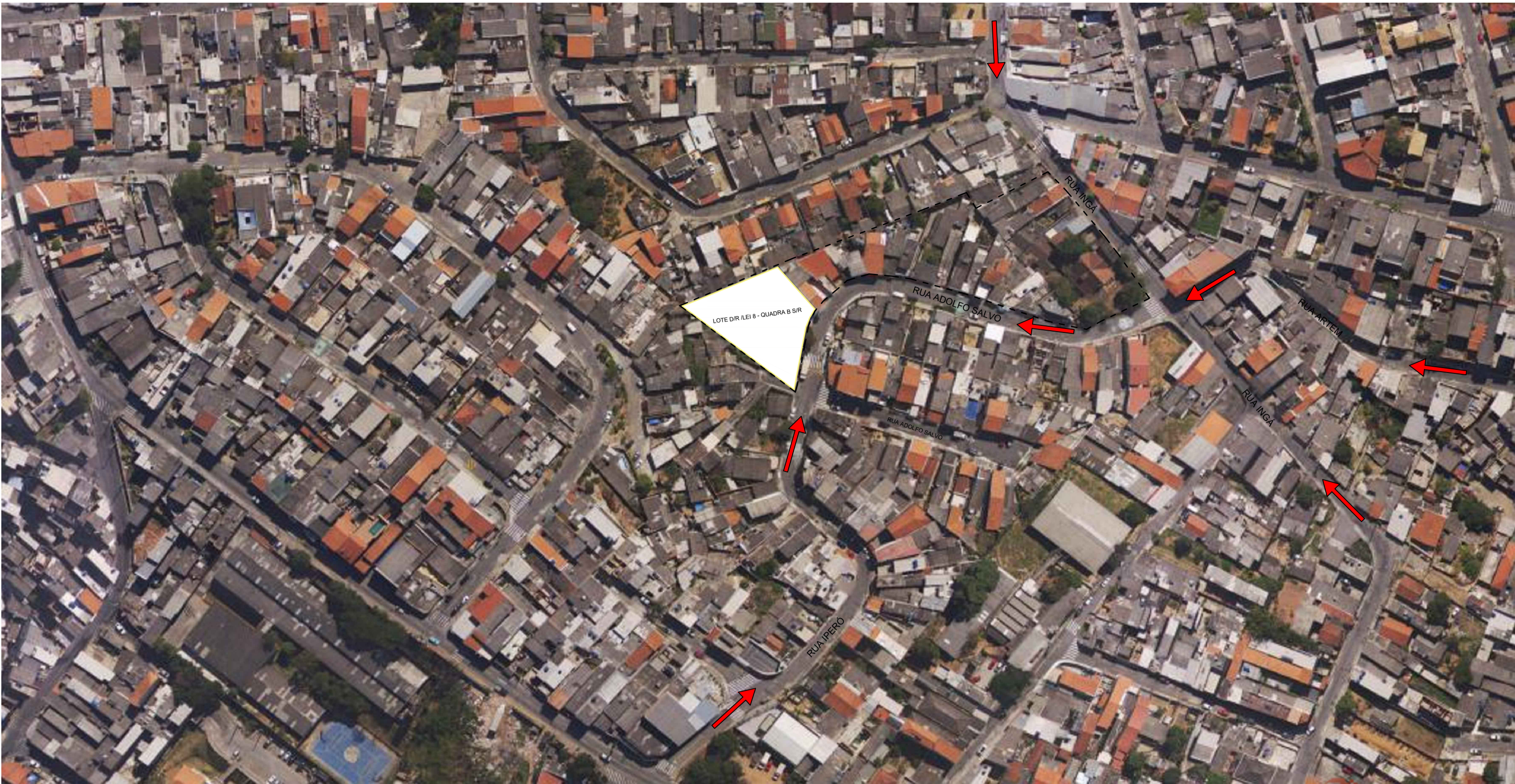
S / ESCALA