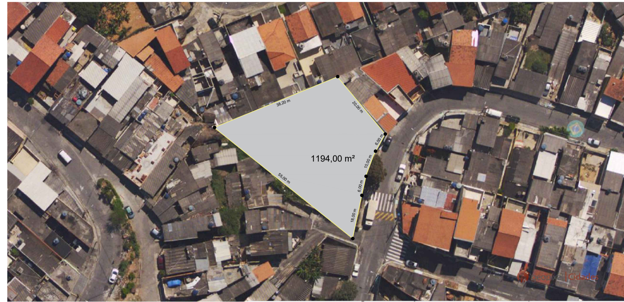
S / ESCALA